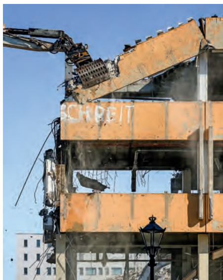
Viele Bauten mussten schon weichen. Mit ihnen auch die Wandbilder.