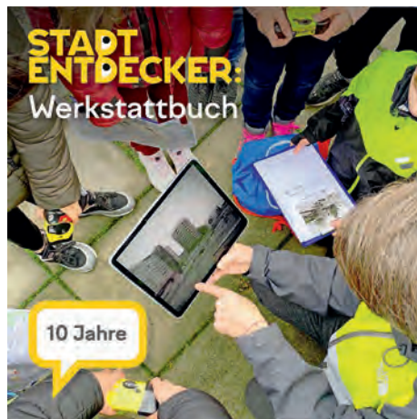
Werkstattbuch, Grafik: KOMMUNIKATION, von Jonas

„Die Stadtentdecker“ ist ein Projekt der Brandenburgischen Architektenkammer, gefördert durch das Ministerium für Infrastruktur und Landesplanung (MIL), in Kooperation mit dem Landesinstitut für Schule und Medien Berlin-Brandenburg (LISUM), unterstützt durch das Ministerium für Bildung, Jugend und Sport (MBJS). Mehr Infos finden Sie unter www.ak-brandenburg.de