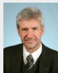
Holger Rupprecht Minister für Bildung, Jugend und Sport des Landes Brandenburg