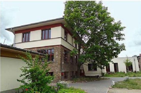
Musterprojekt, Außenanlage