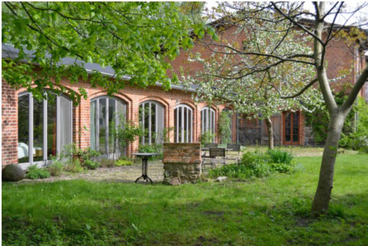
Remise Musterdorf

↪ Startseite Baukultur ↪ Büros & Projekte ↪ Musterprojekt