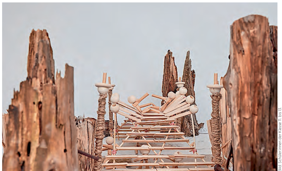
„Polterbrücke“, Oberschule Briesen (Mark), Brandenburg (2. Preis, Kategorie 7. bis 10. Klasse),