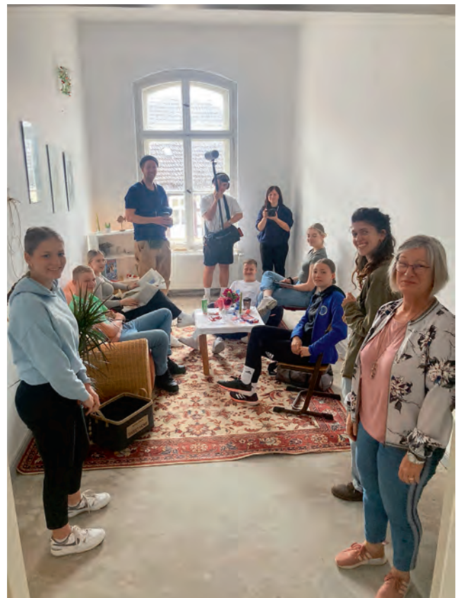
Die „Postentdecker“ im gestalteten Raum, der zur Filmkulisse wurde.

Projektbegleitende Architektin und Text: Mareike Zabel