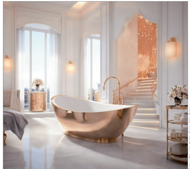
Mit KI visualisiertes Spa-Hotel im Offizierskasino

Projektbegleitender Architekt und Textverfasser: Alexander Paul